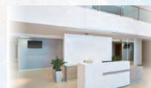
企業エントランスや商業施設