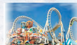
アミューズメント施設